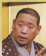
落語家 笑福亭 松喬